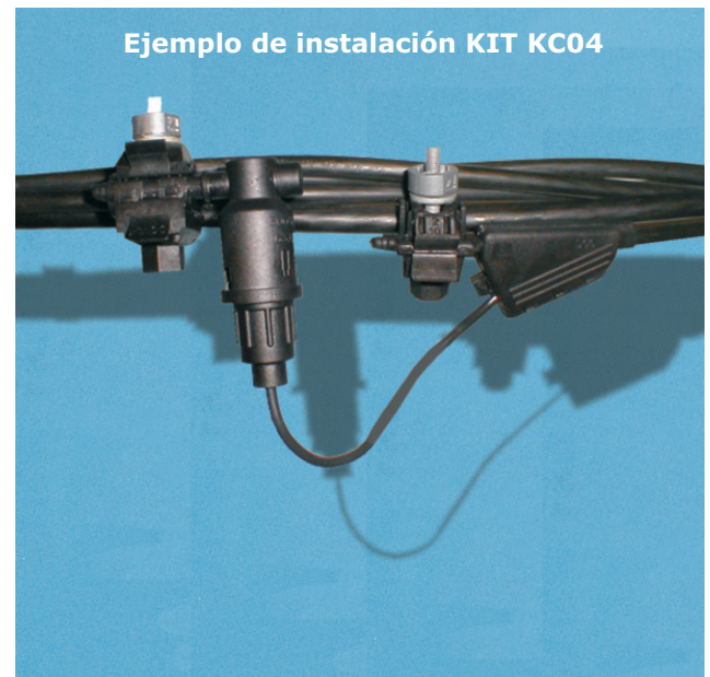
Ejemplo de instalación KIT KC04